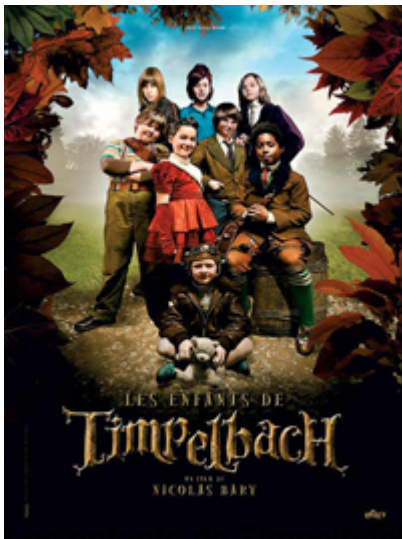
Les enfants de Timpelbach

Jeudi, 19 Mai 2011 21:05 - Mis à jour Vendredi, 20 Mai 2011 07:39