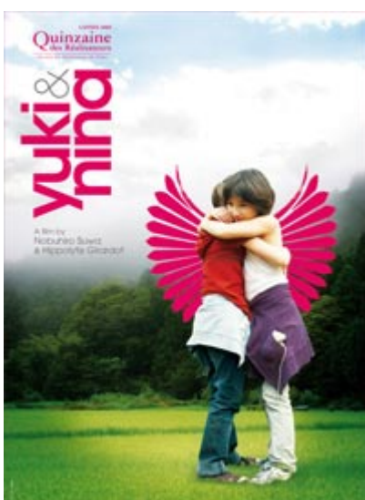
Yuki et Nina